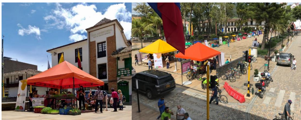
Imagen 20: Desarrollo de los mercados campesinos. Parque Principal

Uno de los espacios por naturaleza para el desarrollo de la comercialización, son los mercados campesinos el cual fue llevado a Acuerdo Municipal Nro. 5 de 2021 “Por medio del cual se institucionaliza y se determinan las disposiciones generales, referentes al mercado campesino como estrategia del plan local de seguridad alimentaria en el municipio de La Ceja del Tambo Antioquia”