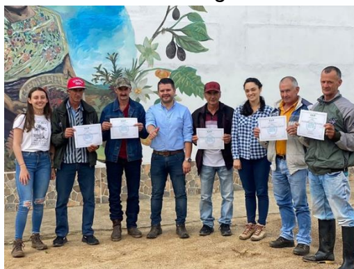
Imagen 21: Entrega certificaciones BPA. Corregimiento San José

Las Buenas Prácticas Agrícolas, son un conjunto de principios, normas y recomendaciones técnicas aplicables a la producción, procesamiento y transporte de alimentos, orientadas a cuidar la salud humana, proteger el ambiente y mejorar las condiciones de los trabajadores y su familia. Bajo el convenio realizado con el SENA, el ICA y Sistema Universitario del Eje Cafetero (SUEJE), se adelantó proceso de formación e implementación de Buenas Prácticas Agrícolas para 8 productores del municipio de La Ceja .