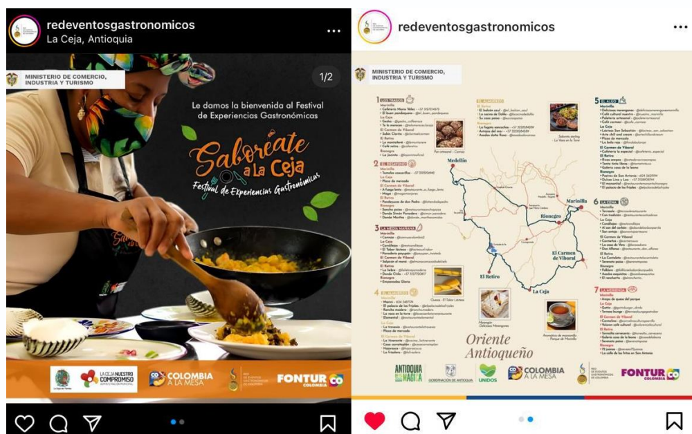
Imagen 4: Promoción festival de gastronomía en portales Ministerio de Comercio y Turismo.

Este festival tiene como propósito incrementar las visitas de los comensales a los diferentes establecimientos de comercio dedicados a la preparación de alimentos, al igual que incrementar el nivel de ventas de los mismos, por otro lado, también se tiene como propósito resaltar los mejores platos y experiencias de gastronomía, valorando la presentación, los sabores, la innovación y los valores agregados que entrega cada establecimiento. Este ejercicio estuvo acompañado por expertos y chefs de trayectoria que brindan capacitación y herramientas a los restaurantes para posicionarse en la gastronomía y a la vez contribuir al desarrollo de un importante atractivo turístico para el municipio.