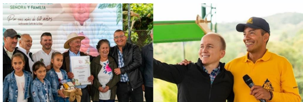
Imagen 8: Final y Premiación Concurso calidad de café, Vereda La Loma.

Este concurso fue desarrollado en alianza con la Federación Nacional de Cafeteros y la Cooperativa de Caficultores de Antioquia, en un proceso donde se evaluó la calidad y características especiales de las tazas de café de los participantes, mediante procesos de catación y barismo de expertos, otorgando calificaciones según las características organolépticas de los lotes participantes. Finalmente, como objetivo, a parte de la promoción de la cultura cafetera en el municipio, las mejores 9 tazas recibieron incentivos representados en activos fijos productivos para el mejoramiento de producción en las fincas cafeteras.