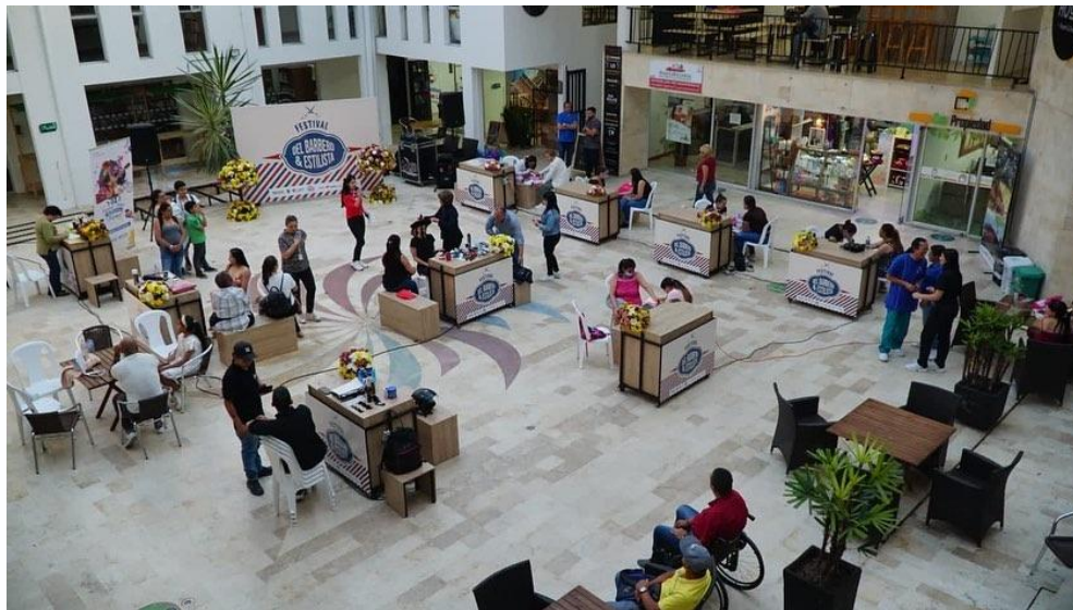
Imagen 13: Desarrollo Festival de Barberos y Estilistas, en el marco de las fiestas tradicionales. Punto Ciem.

En el municipio existen cerca de 300 unidades de negocio dedicadas a este tipo de actividades, por lo que se proyecta poder acompañar el gremio en proceso de formación administrativa, de costos, marketing, salud pública y ferias o espacios que le den visibilidad a este importante sector de la economía local. En esta primera versión, se contó con una muestra de talentos, técnicas y capacidades de cerca de 30 profesionales del gremio.