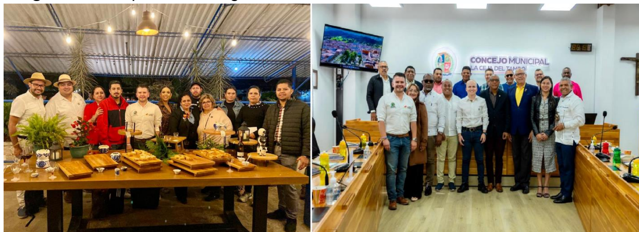
Imagen 16: Recepción de delegaciones internacionales