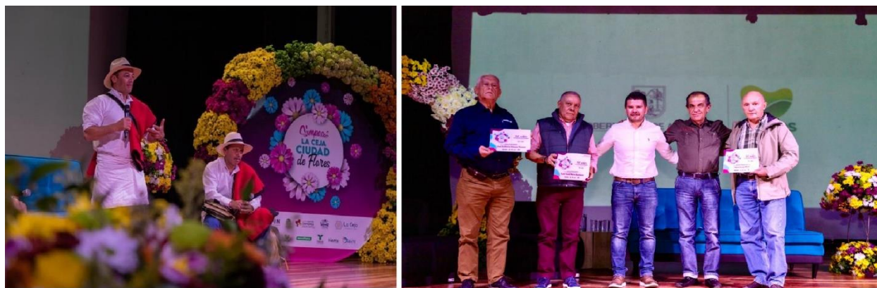
Imagen 14: Desarrollo Simposio La Ceja, ciudad de Flores, en el marco de las fiestas tradicionales. Teatro Municipal

En este marco también realizó reconocimiento a la tradición silletera propia de la cultura de las flores y a los ingenieros que hicieron parte del asentamiento de la industria floricultora en el municipio, hace 50 años. Este espacio tuvo el apoyo de los principales cultivos de flores que hacen presencia en el municipio, así como AsoColflores, Grupo Geffa, Gobernación de Antioquia, Fenalco, Natural Control, Invest in Oriente, entre otros.