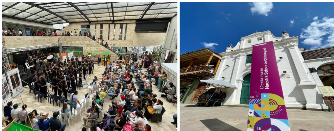
Imagen 27: Feria Mercados Culturales y Equipamiento Distrito Creativo.

Durante el año 2022, se avanzó en los procesos de consolidación del modelo de gobernanza del Área de Desarrollo Naranja mecanismos bajo el cual los actores tanto públicos como privados pueden participar en la toma de decisiones y llevar a cabo los procesos de sostenibilidad. Según la guía metodológica para la delimitación e implementación de áreas de desarrollo naranja en Colombia, El modelo de gobernanza de un Área de Desarrollo Naranja puede definirse como el esquema para gestionar los asuntos de interés común del ADN y contiene las reglas de juego para la representación, participación, toma de decisiones y administración del distrito creativo. Entre otros aspectos, el modelo de gobernanza debe definirse en el marco de lo estipulado en la normativa vigente; en segunda instancia es necesario que dé respuesta a las necesidades, vocación y objetivos del ADN.