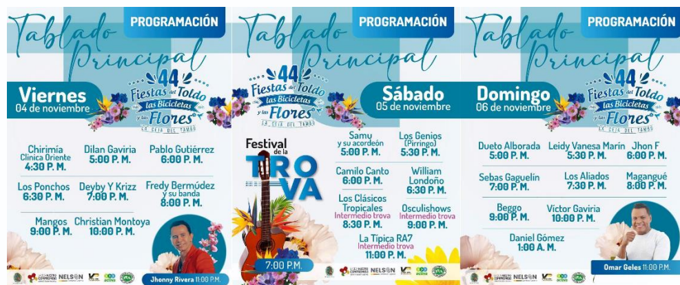
Imagen 26: Piezas gráficas del proceso de promoción de las fiestas tradicionales.

De igual forma, se trabajó de forma conjunta con las unidades comerciales que hacen parte de la cadena del turismo como el sector transporte, restaurantes, establecimientos de comercio nocturnos y hoteles que registraron ocupación por encima del 95%