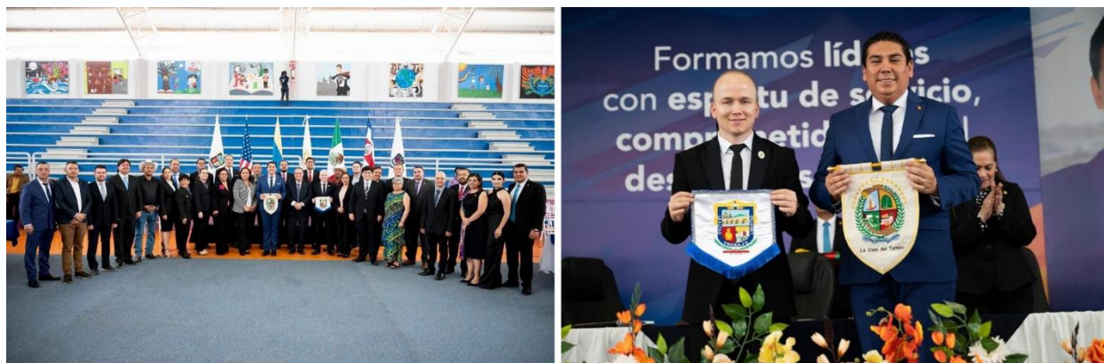
Imagen 17: Suscripción Acuerdo de Hermanamiento con La Piedad de Cabadas, México

El Acuerdo de Hermanamiento suscrito, tiene como propósito enriquecer aspectos culturales, sociales, turísticos, agropecuarios, medio ambientales y económicos, así como la creación de oportunidades de intercambio profesional, cultural, académico y económico, y ampliar la cooperación para fomentar la calidad de vida de sus habitantes, el fortalecimiento de las condiciones de competitividad del territorio y de buena voluntad entre las ciudades hermanas, en el marco de los Objetivos de Desarrollo Sostenible acordados en la Agenda 2030 por las Naciones Unidas; específicamente se definió de manera conjunta entre ambas ciudades, cuatro líneas sobre las cuales avanza el plan de trabajo y agenda diplomática.