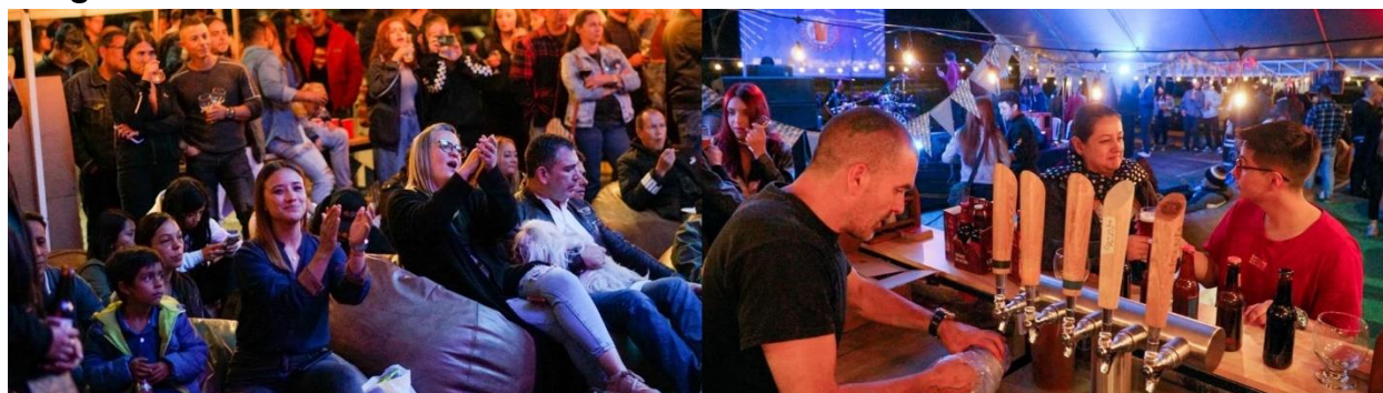
Imagen 14: Desarrollo Festival Emoción Cervecera

Se contó con la asistencia de cerca de 4.000 personas durante los dos días del festival, con ventas cercanas a los $ 8 millones, además que también se propició y ambiente el espacio con presencia de artistas con bandas y Dj locales.