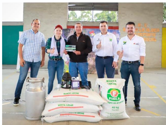
Imagen 21: Entrega kits lácteos productores agropecuarios. Coliseo la Aldea

En gestiones realizadas ante el Ministerio de Agricultura y la Gobernación Antioquia, en la vigencia 2022 se logró entregar a 105 pequeños productores lácteos, un apoyo por cerca de $ 1.000.000. que contenía 4 bultos de concentrado, cantina tipo caneca y un kit de buenas prácticas de ordeño.