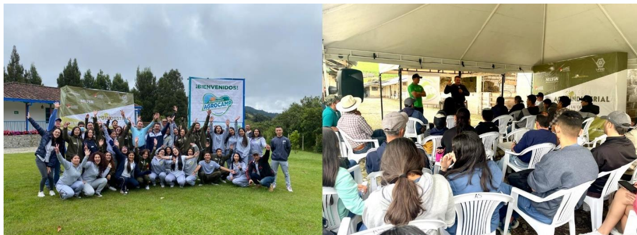
Imagen 10: Agenda Semana Feria Agro Industrial