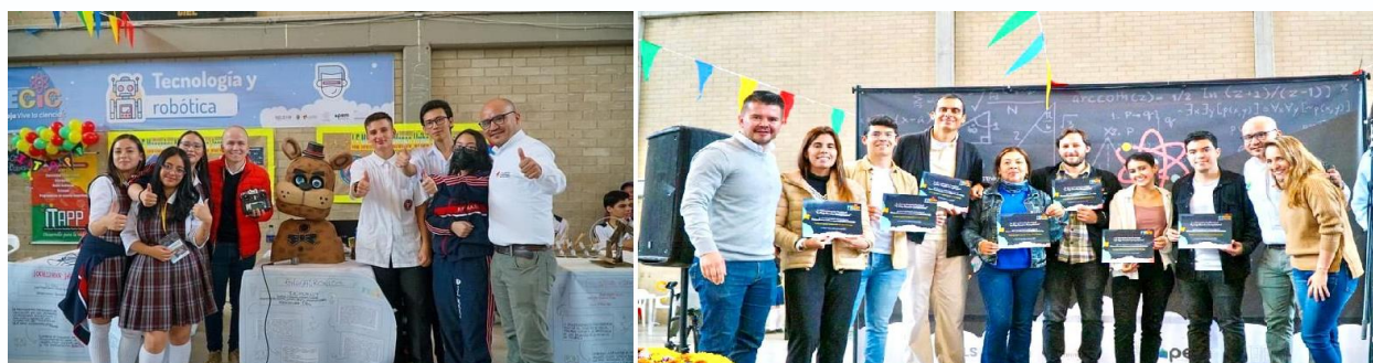
Imagen 26: Fase Final y Premiación FECI 2022

En la primera versión se desarrolló, con la definición de cuatro líneas de participación, las cuales se describen a continuación: