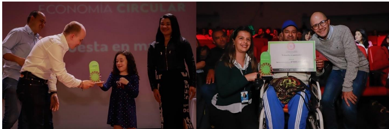
Imagen 3: Premación concurso de emprendimiento