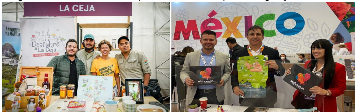
Imagen 25: Promoción del Municipio en la Feria Antioquia es Mágica y ANATO

De igual forma, paralelo al ejercicio de promoción turística se trabaja de la mano de los operadores y prestadores de servicios turísticos, en procesos de formación, capacitación y herramientas que permitan alcanzar niveles competitivos para atender y marcar diferencia con los turistas que nos visitan