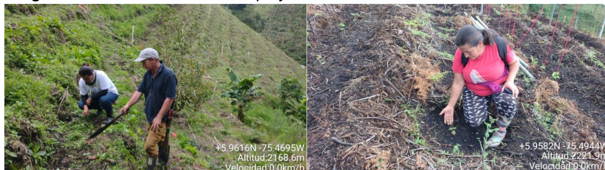
Imagen 23: Asistencia técnica en el proyecto de Mora.

A cada familia beneficiada se le está renovando un área de 3.000m 2 (0.3 hectáreas), mediante la entrega de 1.000 plántulas de mora variedad Ecotipo San Antonia (con una densidad de siembra de 1.5 metros entre plantas y 2 metros entre surcos), dotación de materiales como tijeras, guaduas, canastillas plásticas, envaraderas plásticas, alambres, tiras, tijeras podadoras y material vegetal, insumos como fertilizantes edáficos y foliares, productos para el control de plagas y enfermedades, además de protectantes y desinfectantes; se suministrará análisis de suelos por productor para un total de 56 análisis.