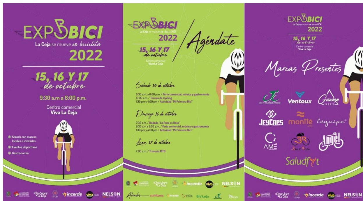
Imagen 12: Desarrollo EXPO BICI 2022