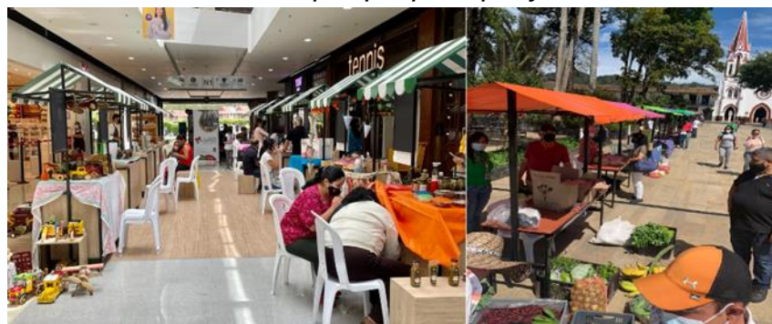
Imagen 2: Desarrollo de Ferias en el parque principal y CC VIVA

Durante el año 2022, se realizaron 38 ferias de tipo permanente, es decir, las que se realizan de forma periódica en espacios estratégicos como el parque principal, los centros comerciales, parques y lugares estratégicos para los diferentes sectores. Parte de estos espacios han sido las ferias de emprendimiento, mercados campesinos y ferias sectoriales del comercio, en las que se le ha entregado la oportunidad a diferentes iniciativas de tener espacios para mostrar sus productos y servicios a múltiples públicos sin ningún costo.