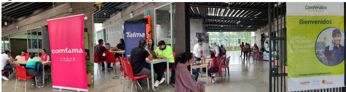
Imagen 1: Desarrollo de Ferias de Empleo

Según las valoraciones realizadas, estos cursos y certificaciones en competencias laborales tienen un costo aproximado de $ 430.MM que se lograron gestionar en beneficio de la comunidad y en mejoramiento de los perfiles y competencias de las personas en búsqueda de empleo.