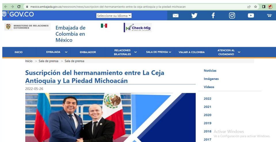
Imagen 18: Registro y publicación del Acuerdo de Hermanamiento, ante la Cancillería de Colombia y la Embajada de Colombia en México.

Se destaca también el acompañamiento de la Cancillería de Colombia y la Embajada de Colombia en México, para la materialización y puesta en marcha de la hermandad entre los dos territorios.