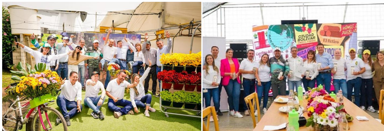
Imagen 24: Evento de inclusión La Ceja en programa Antioquia es Mágica

Antioquia es Mágica es el programa de turismo del Departamento de Antioquia que busca posicionar y fortalecer a los municipios del Departamento como territorios turísticos a nivel local, regional, nacional e internacional; a través del desarrollo de mercados especializados, la instalación de capacidades territoriales y el marketing enfocados en los saberes, talentos y vivencias.